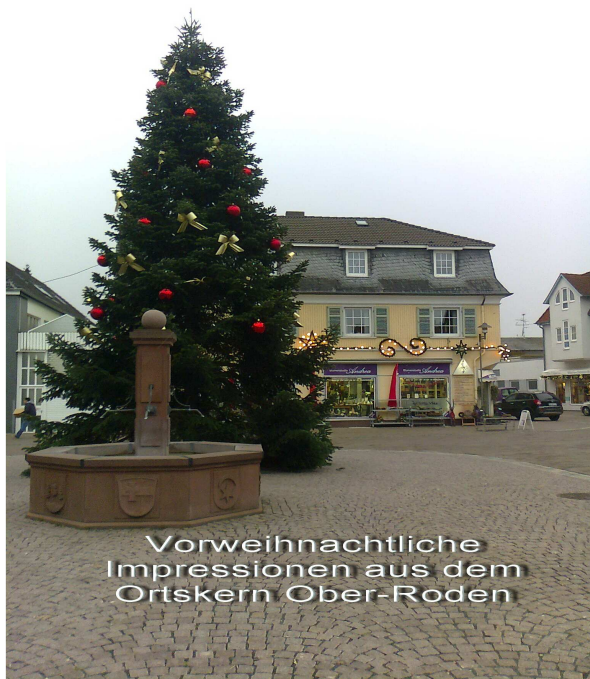
Vorweihnachtliche Impressionen aus dem Ortskern Ober-Roden